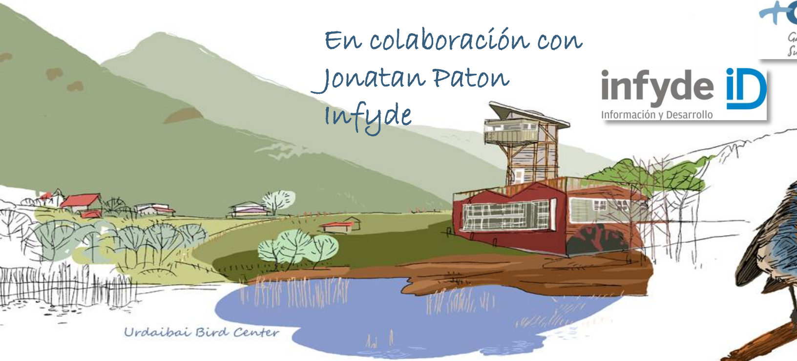
Urdaibai Bird Center