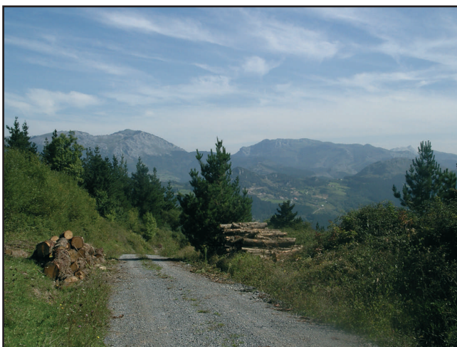
Urkiola eta Dima de Murgatik

Baserrin, hariztien eta meten artean, Sarasola gurutzatu eta artez-arte jarraituko dugu, harik eta beste bidegurutze batera iritsi arte. Ezkerreko mendi-bideak Kareaga auzora eramango gaitu, baina guk eskuinekoa hartuko dugu. Pinudi gazteak eta zaharrak zeharkatu ondoren, Argiñao auzotik jaisten den ibilbide nagusira helduko gara (PR-BI 11ra). Larrabarren baserriaren alboetik igaroko gara, Ibarrondo ibaira iristeko. Ibaia zeharkatutakoan, ibilguaren paretik joango gara, Isasi auzotik igaro ostean berriro ere Ermitabarrira heltzeko.