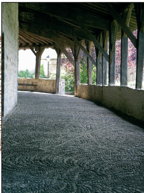
Olabarrietako Santo Tomas

Antzina, udaberrian, Zeberioako artaldeak Santo Tomas elizako arkupean biltzen ziren, eta, parrokoaren bedeinkapenaren ostean, hainbat artzainen gidaritzapean abiatzen ziren Arrabako larreetarantz. Ibilbideak badaia haren zati bat egiteko aukera eskainiko digu, Zeberioako ondarearen zenbait altxorrez gozatzen dugun bitartean. PR-BI 11 ibilbidearen saihasbideetako bat da, hain zuzen ere.