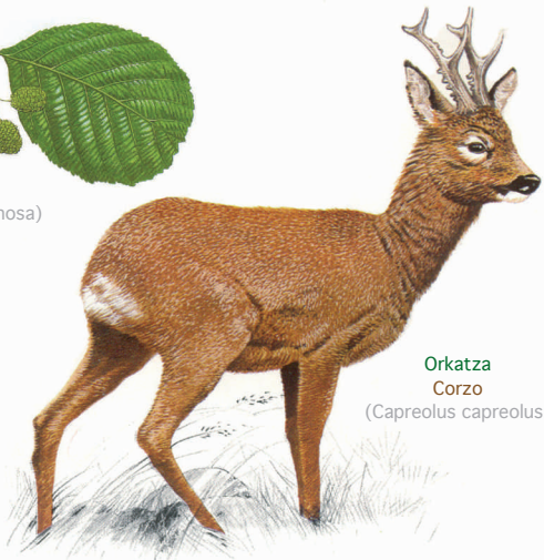
Orkatza Corzo (Capreolus capreolus)