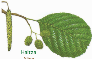
Haltza Aliso (Alnus glutinosa)

Iglesia de Santo Tomás de Olabarrieta, fuente de Uratsa, robledales de Ermitabarri, río Gezala, caserío de Gezalabekoa, casa de baños, alisos, ericeras, barrio de Sarasola, barrio de Kareaga.