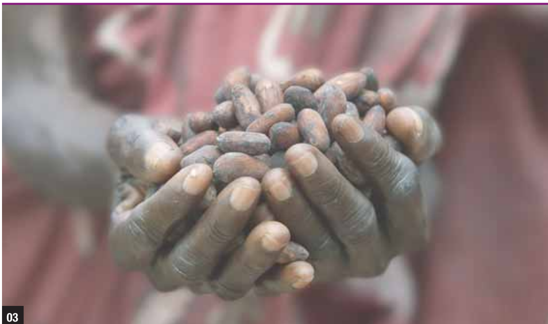
Granos de cacao