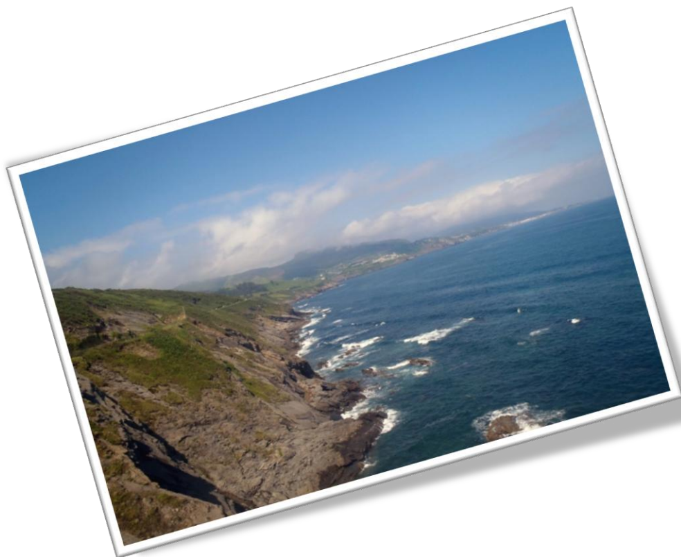
Espectacular recorrido de la Vía Verde a través del acantilado costero