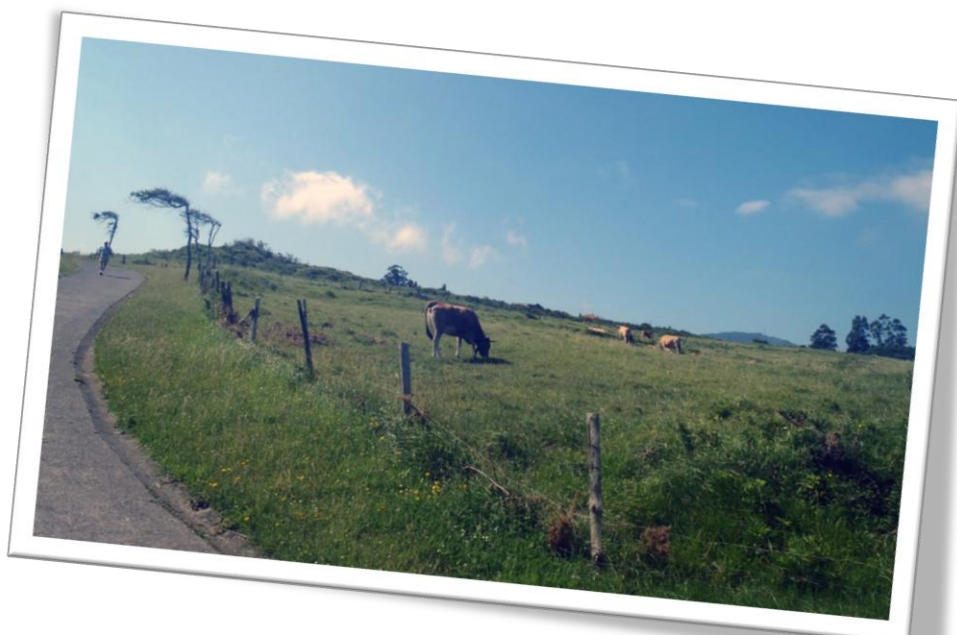
La agricultura y la ganadería mantienen los prados costeros que limitan con la Vía Verde

la luz y difumina las siluetas costeras. La brisa es otro elemento constante en este paisaje. El relieve es notablemente más llano que en los otros dos tramos, pues la orografía se suaviza mucho en nuestras costas.