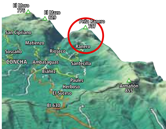
⊗ Indicaciones sobre el terreno.

Desde este punto podemos acercarnos a la Torca del Carlista, siendo esta una sima en dirección N.E. con una de las mayores salas del mundo ④. También es interesante visitar el Mirador del Mirón, estando situado al borde del abismo entre El Mazo y Peña Ranero, al que llegaremos descendiendo por el mismo sendero para tomar otro en dirección O. hacia un pequeño valle de unos 200 m dentro del macizo de Peña Ranero ⑤. Regresamos de nuevo al Collado Valseca para descender hacia la cueva de Pozalagua de gran interés por sus estalactitas excéntricas y una longitud de 125 m. El sendero que ahora tomamos muere justo junto a la entrada de la cueva ⑥, desde este punto nos acercamos hasta el aparcamiento para continuar por la carretera que nos lleva a Ranero.