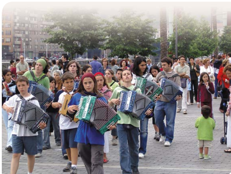
Eskola Agenda 21 delakoak oso garrantzitsuak dira Agenda 21en barruan.

Gure erkidegoari dagokionez, Garapen Iraunkorrerako Euskal Ingurumen Estrategia (2002-2020) deritzonak honako eginkizuna du: euskal gizarteak erdietsi behar dituen ingurumen-helburuak ezartzea, egungo belaunaldiari bizi-kalitate hobereana bermatuz eta geroko belaunaldien ongizatea arriskuan jarri gabe.