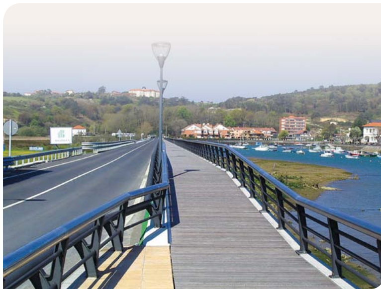
Agenda 21 iraunkortasuna lortzeko bideetako bat da.

Tokiko Agendaren jatorria Ingurumen eta Garapen Iraunkorrari buruzko Nazio Batuen Konferentzian dago, hain zuzen ere, 1992an Rio de Janeiron egin zen Lurrari buruzko Goi Bileran . “XXI. mendeko garapen iraunkorrerako Egitasmo Globala” izenekotik sortu zen – 21 Egitasmoa-, aipatutako Lurrari buruzko Goi Bilera horren baitan, eta tokiko agintariei protagonismoa aitortzen die garapen iraunkor horretan. Bestalde, dei egiten die tokiko agintariei Tokiko Agenda 21 landu dezaten.