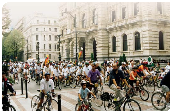
Pixkanaka-pixkanaka iraunkortasunera bidean.