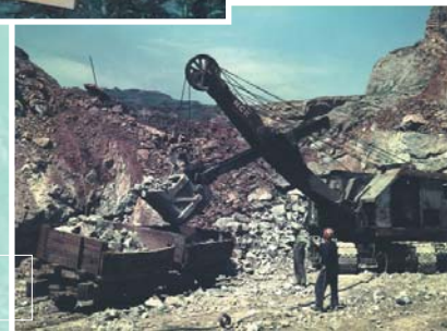
Orconera konpainiaren zama-lanak Labores de carga de la compañía Orconera (1965)

Hacia 1984 se abandonaron los labores en superficie y el trabajo se concentró en las galerías subterráneas, donde se excavaban grandes cámaras que podrían albergar hasta una catedral. La suma de todas las galerías ronda los 50 kms y los túneles más largos llegan hasta Las Carreras (Abanto-Zierbena). Fue la última mina de hierro en funcionamiento de Bizkaia y se cerró por falta de rentabilidad en el año 1993.