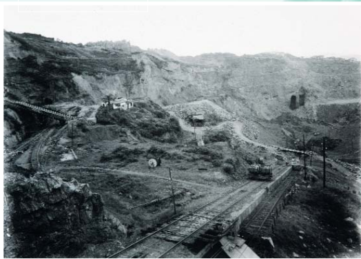
Concha meatzea Mina Concha (1964)

El hierro de los Montes de Triano se explotaba ya en la época de los romanos, aunque la extracción a gran escala se desarrolló entre 1876 y 1930 (el año de mayor producción fue 1899). El 90% del mineral de Bizkaia se extrajo a cielo abierto, en forma de canteras o cortas.