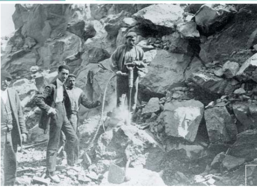
Franco-Belga konpainiaren laztabin mekanikoak Barrenos mecánicos de la compañía Franco-Belga

Trianoko Mendietako burdina erromatarren garairako ustiatzen zen jada; hala ere, eskala handiko erauzketa 1876-1930 aldian egin zen (produktiorik handiena 1899. urtean lortu zuten). Bizkaiko mineralaren %90a aire zabalean erauzi zen, harrobi edo "korta" deiturikoetan.