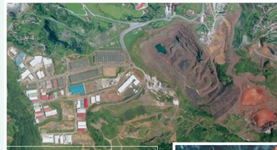
La Corta eta El Campillo industrialdea La Corta y polígono industrial El Campillo

La Corta de Bodovalle, en Gallarta (Abanto-Zierbena), es un enclave único en Euskadi, ya que se trata de la mina más grande y del punto más bajo a cielo abierto. La riqueza del mineral de Bodovalle era conocida desde la antigüedad, por lo que a finales del siglo XIX la compañía Franco-Belga empezó a explotar una de las minas más emblemáticas: Concha 2ª. La extracción a cielo abierto se incrementó de manera espectacular a partir de 1968, cuando la empresa Agruminsa se hizo cargo de la explotación, lo que provocó la desaparición de la mayor parte del barrio de Gallarta.