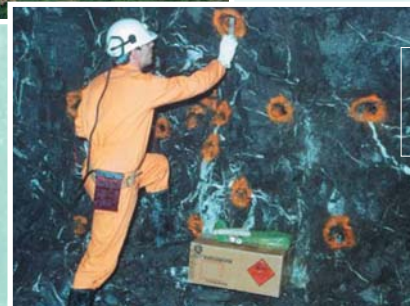
Lehergaiak ipintzen galeria batean Colocación de explosivos en una galería (1987)

1984 aldera, lurrazaleko lanei utzi eta lur azpiko galerietan egiten hasi zen lan guztia; bertan, ganbera handiak egiten ziren, katedral baten tamainakoak. Galeriek, guztira 50 bat kilometro dituzte, eta tunelik luzeenak Las Carreras auzoraino (Abanto-Zierbena) iristen dira. Bizkaian jardunean egon zen azken burdina-meatzea izan zen, eta 1993an itxi zuten, ez zelako errentagarria.