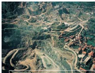
La Corta eta Gallarta antzinako auzoa La Corta y el barrio antiguo de Gallarta (1964)