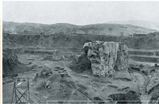
Parcocha meatzea XX. mendearen hasieran Mina Parcocha a principios del siglo XX

XIX. mendearen amaieran, lehergailuak erabiltzen hasi ziren burdina-minerala aire zabalean erauzteko. Hori dela-eta, hainbat lekutan maila freatikoraino iristen zen eta orduan ura ukatu behar izaten zuten, ponpen bidez, lanean jarraitu ahal izateko. Meatzaritza-ustia-pena uztean, lurpeko ura azaleratu egin zen eta hainbat putzu sortu ziren, La Arboledakoak esate baterako: Hostión, Blondis eta Parkotxa.