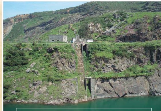
Plano inklinatua eta meatze-instalazioak Blondis putzuan Plano inclinado e instalaciones mineras en el Pozo Blondis

En el pozo Parkotxa, situado debajo de Barrionuevo, estaban las minas Parcocha y Unión. En los años 70 del siglo XX fue utilizado para verter los lodos del lavadero de mineral de Larreireta, de ahí su color marrón.