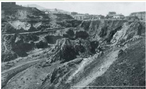
Mame, Carmen eta Orconera meatzeak XX. mendearen hasieran. Atzealdean, La Arboleda Minas Mame, Carmen y Orconera a principios del siglo XX. Al fondo, La Arboleda

K.o. I. mendean, Plinio "Zaharrak" Kantauri itsasoaren ondoan guztiz burdinazkoa zen mendi bat zegoela esan zuen; La Arboleda eta Barri-nuevoren artekoa, hain zuzen ere, horrelakoa zen. Mendi hori desager-tu egin zen, burdina aire zabalean erauzi baitzuten, batez ere 1876-1930 aldian. Hala ere, joan den mende-ko 80ko hamarkadaraino etsi zi-tzaion bertan meatzaritza-jarduerari.