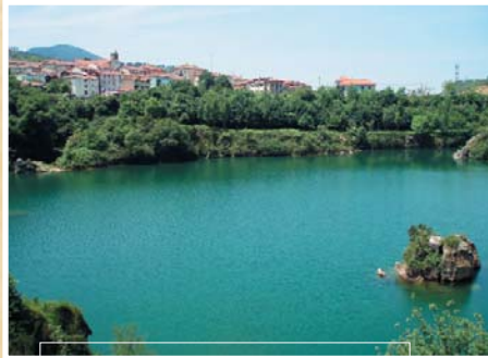
Hostión putzua, La Arboledaren ondoan Pozo Hostión, junto a La Arboleda