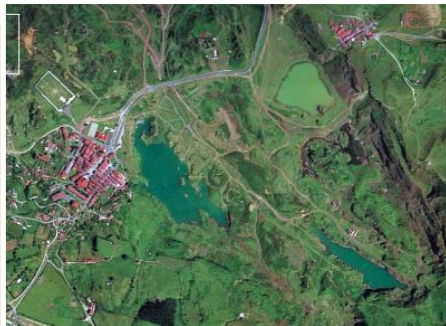
La Arboledako mea aldea Zona minera de La Arboleda

La Arboledako atsedenekutik abiatuta, PEÑAS NEGRAS Zentroko 2. ibilbidea (marroia) egin daiteke. Ibilbide horrek hiru putzuak lotzen ditu. Larreinetatik datorren errepidean barrena ere joan daiteke putzuen inguru hartara. Ibilaldiak 45 minutu inguru irauten du.