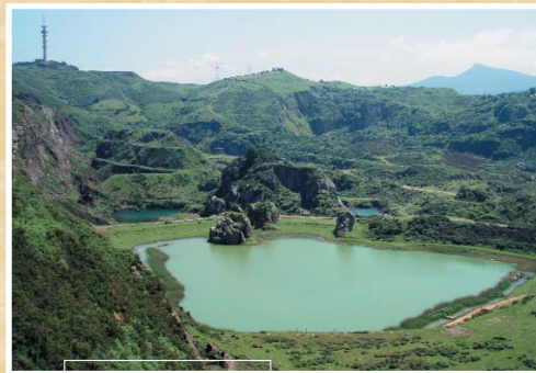
Pozo Parkotxa putzua

A finales del siglo XIX se empezaron a utilizar los explosivos para la extracción a cielo abierto del mineral de hierro. Debido a esto, en algunas zonas se alcanzaba el nivel freático y cuando esto ocurría había que achicar el agua con bombas para poder seguir trabajando. Al abandonarse la explotación minera, el agua subterránea afloró a la superficie y se formaron pozos como los de La Arboleda: Hostión, Blondis y Parkotxa.