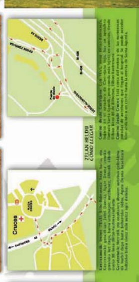
ZULAN HELDUJ COORD LEGUIR