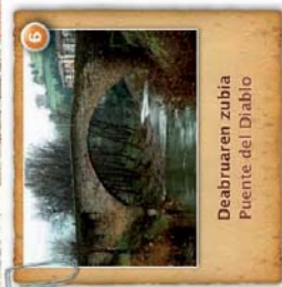
Deabruaren zubia Puente del Diablo