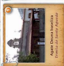
Agate Deuna baseliza Ermita de Santa Agueda