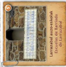
Larrazabal auzo-eskolak Escuelas de Barriada de Larrazabal