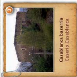
Casabianca baserría Caserio Casablanca