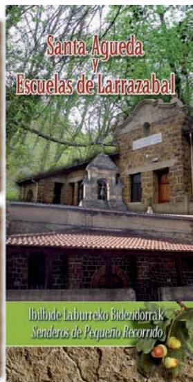
Santa Agueda Escuelas de Larrazabal