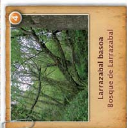
Larrazabal basoa Bosque de Larrazabal