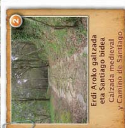
Erdi Aroko gartzada eta Santiago bidea Calzada medieval y Camino de Santiago