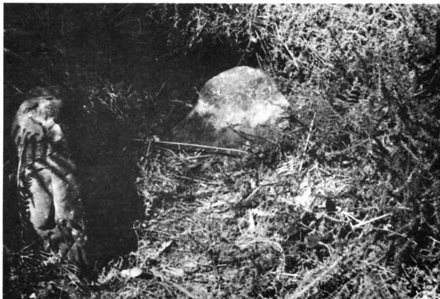
Foto 2. Dolmen de Saierrikolanda II.