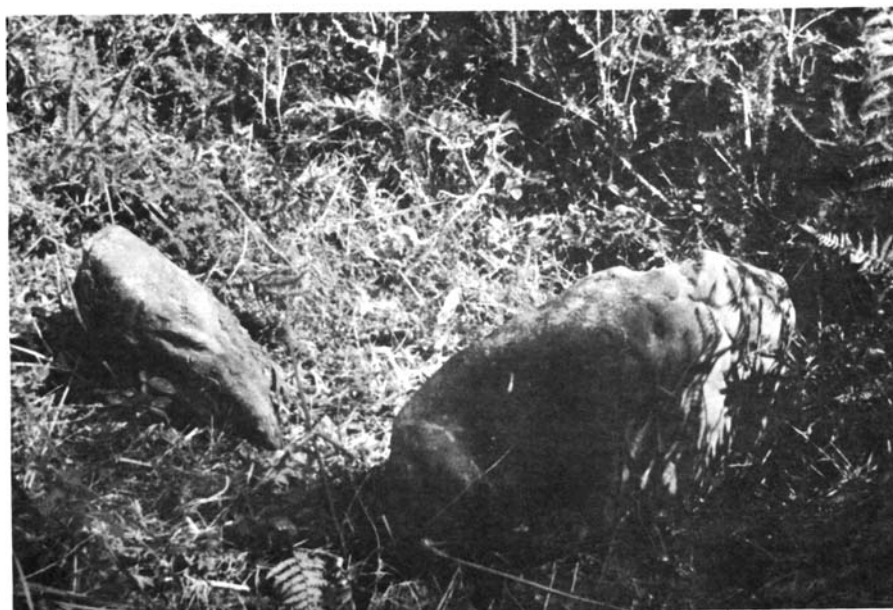
Foto 1. Dolmen de Saierrikolanda II.