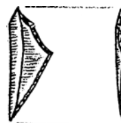
Fig. 1. Pieza hallada en las proximidades de Munarrikolanda I.

En las proximidades del mismo hallamos, a flor de tierra, la pieza de la figura n.º 1.