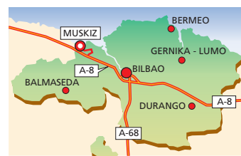
Kobarongo mea kargatzeko tokia Muskiz.