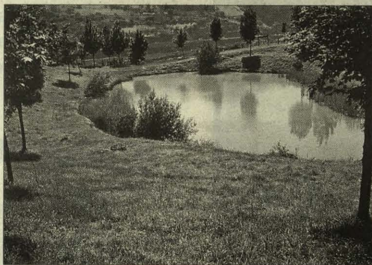
Laguna del parque de Montefuerte

mite obsequiarnos con bellas vistas del bajo Nervión, del Gran Bilbao, del cercano meandro de La Peña, del Serantes -al fondo, cerca del mar-, y del monte Ganguren. Por su parte, la laguna está rodeada de espadañas y de una planta de origen argentino llamada Cortaderia que da bellos plumeros y que se adapta con facilidad a nuestro paisaje donde es ya muy común. No será raro que observemos simpáticos petirrojos, esos pájaros, que como su nombre indica tienen el pecho colorado. Muchos de ellos llegan del norte de Europa (Escocia, Escandinavia) para pasar el invierno entre nosotros. Dice la leyenda que su pecho rojo es una gota de sangre que le cayó al petirrojo que ayudó a Cristo a arrancarse las espinas de la frente. Gracias a ese gesto, como la golondrina, el petirrojo es un pájaro respetado en el campo y que no se caza. Como monumentos a la minería del pasado encontramos junto a la laguna piedras de caliza en cuyas vetas se encontraban los minerales beneficiados en el pasado. Seguimos su-