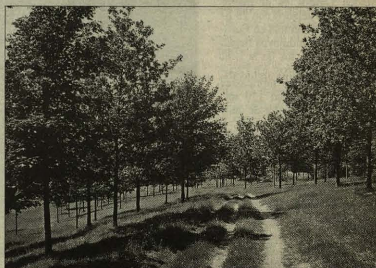
Robles en el camino de Malmásin