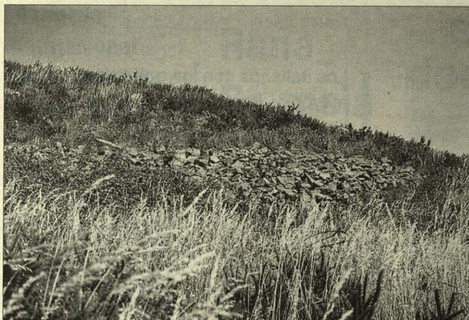
Restos de una de las murallas del castro céltico